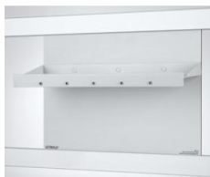
Table pour électrochimie CPS pour 664 407

À utiliser avec l'appareil de démonstration Électrochimie, CPS ( 664 4071 ) ; pour les cuves à électrolyse et les tubes en U (avec fiches à ressort 59121 ) pour l'exécution d'expériences de démonstration en électrochimie.