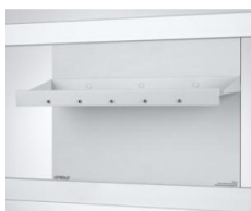
Table pour électrochimie CPS pour 664 407

À utiliser avec l'appareil de démonstration Électrochimie, CPS ( 664 4071 ) ; pour les cuves à électrolyse et les tubes en U (avec fiches à ressort 59121) pour l'exécution d'expériences de démonstration en électrochimie.